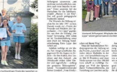
Vorstand Schürmann, Mitglieder der Jury und Gewinnerinnen des Projekts „Humor in der Kita“.

Die Stiftung „Für Lippe“ wird 20 Jahre alt. Zum Geburtstag startet sie ein neues Projekt.