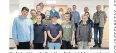
Die Unterstützer des Projektes „fit for job“ freuen sich mit den Schülern über die Erfolge.

Jugendliche werden in einem Projekt für den Übergang in die Berufswelt vorbereitet